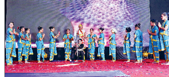
रेवाड़ी। समारोह में प्रस्तुति देते हुए छात्राएं।