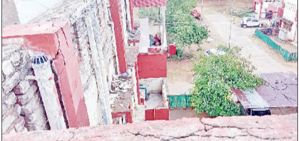
रेवाड़ी। पुलिस क्वार्टरों की दयनीय हालत।