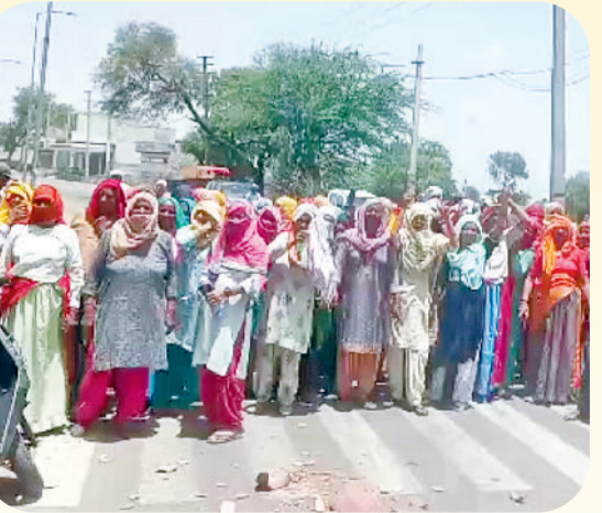
रेवाड़ी। जाम के दौरान मटकें फोड़ी महिलाएं।

रेवाड़ी। क्लेरिकल एसोसिएशन वेलफेयर सोसायटी के आह्वान पर वेतनमान बढ़ोतरी की मांग को लेकर जिले में करीब 48 दिन चली लिपिकों की हड़ताल से सरकारी कार्यालयों में कामकाज ठप रहा। इस दौरान लिपिकों के समर्थन में जिले की सभी यूनिट व सामाजिक संगठन भी सरकार के खिलाफ खड़े हो गए थे। सभी विभागों के लिपिक 35400 रुपए वेतनमान की मांग कर रहे थे। लिपिकों ने इस दौरान पुतले फूंकने के साथ काफी प्रदर्शन किया। बाद में सरकार के आश्वासन के बाद लिपिक काम पर लौटे।