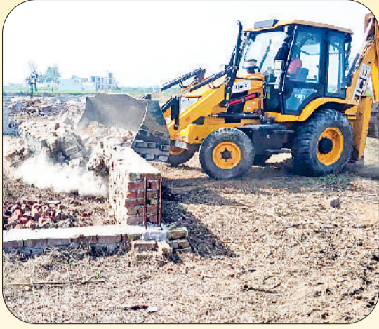
रेवाड़ी। बावल रोड पर अवैध निर्माण तोड़ती जेसीबी।