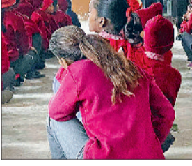
रेवाड़ी। विद्यार्थियों को जानकारी देते हुए।

राजकीय वरिष्ठ माध्यमिक विद्यालय ढालियावास में सेल्फ डिफेंस कैप का आयोजन