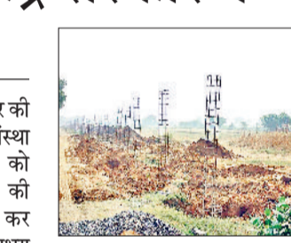
रेवाड़ी। चारदीवारी का चलता कार्य।

लंबे इंतजार के बाद केंद्र सरकार को एम्स निर्माण कराने वाली संस्था एचआईटीईएस ने शनिवार को माजरा में बनने वाले एम्स की बिल्डिंग का टेंडर फाइनल कर दिया। एलएंडटी कंपनी को लगभग 1230 करोड़ रुपये में इसका ठेका दिया गया है। इसके साथ एम्स का शिलान्यास जनवरी माह में ही होने की प्रबल संभावनाएं बन गई हैं। एम्स निर्माण के टेंडर का मामला दिसंबर माह में दो बार अटक गया था। आखिरकार हिट्स ने शनिवार के लार्सन एंड टॉबो कंपनी को जारी पत्र में बताया गया कि एम्स बिल्डिंग के निर्माण ठेका 12,300,969,880 रुपये में फाइनल किया गया है। बिल्डिंग और दूसरे निर्माण सहित इस राशि में सभी गुड्स और सर्विस