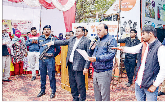
रेवाड़ी। लोगों को शपथ दिलाते सहकारिता मंत्री।

सहकारिता मंत्री ने कार्यक्रम के दौरान ग्रामीणों की बिजली, पानी जैसी मूलभूत सुविधाओं सहित परिवार पहचान पत्र, वृद्धावस्था पेंशन व अन्य शिकायतें व