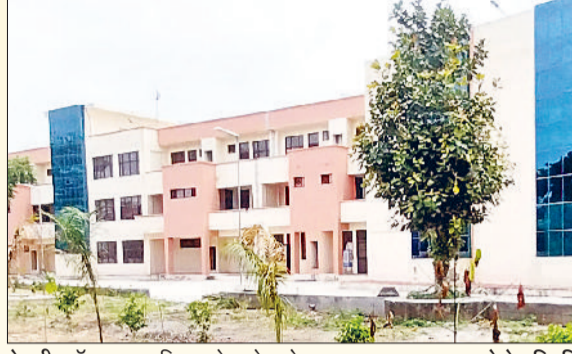
रेवाड़ी। मॉडल टाउन स्थित ओल्ड ऐज होम।

सामाजिक न्याय एवं अधिकारिता विभाग की ओर से मॉडल टाउन में बुजुर्गों को 12.19 करोड़ रुपए की लागत का ओल्ड ऐज होम मिल गया है, जिसमें 12 के करीब बुजुर्गों को आश्रम मिल रहा है। भवन करीब 65 हजार स्क्वियर फुट में बनाया गया है। आधुनिक भवन में 184 बेड की व्यवस्था के साथ बुजुर्गों के स्वास्थ्य को देखते हुए फिजियोथेरेपी सेंटर भी स्थापित है ताकि बुजुर्गों को फिजियोथेरेपिस्ट की सुविधाएं मिल सकें। इसके साथ ही डे-केयर सेंटर, ऑब्जर्वेशन रूम और एंक्टिविटी