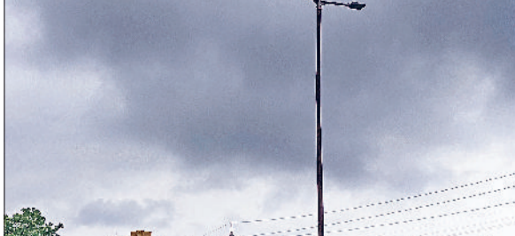
रेवाड़ी। शनिवार को आसमान में छाप बादल।

जारी रह सकता है। कोहरा साफ होने व तापमान में गिरने की स्थिति में पाले का असर शुरू हो सकता है। शनिवार को मौसम में थोड़ा बदलाव आया। सुबह के समय कोहरे का असर कम रहा, जिससे सड़कों पर वाहन चालकों को काफी राहत मिली। अधिकतम तापमान 2.2 डिग्री सेल्सियस बढ़कर होकर 16.2 डिग्री पर पहुंच गया। न्यूनतम तापमान भी इतना ही बढ़कर 6.6 डिग्री सेल्सियस दर्ज किया गया। सुबह से ही कोहरा कम रहने के बावजूद सूरज नहीं निकलने से अंधेरा छाया रहा। दोपहर तक सूरज निकलने के बाद मौसम