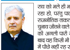
राव इंद्रजीत सिंह।

आक्रामक तैवरों के साथ देखने को मिलेंगे। सत्तर के दशक में प्रदेश और नब्बे के दशक में केंद्र की राजनीति में प्रवेश करने वाले राव इंद्रजीत सिंह राजनीति का लंबा अनुभव साथ लिए हुए हैं। इस दौरान उन्होंने कई उतार-