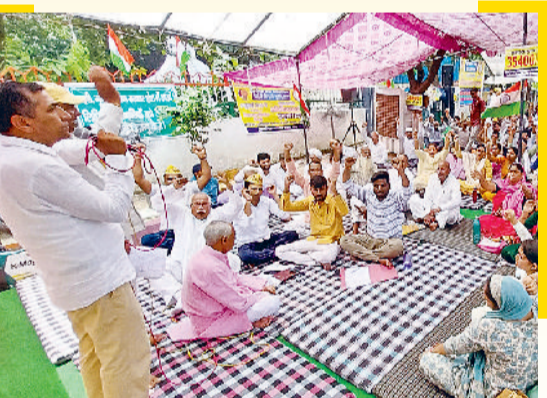
रेवाड़ी। हड़ताल के दौरान बैठे लिपिक।