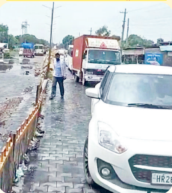
रेवाड़ी। अगस्त माह में बनाया गया रैप।

रेवाड़ी। राजस्थान के मिवाड़ी औद्योगिक क्षेत्र से धारुहेड़ा में छोड़े गए दूषित पानी के जलभराव को लेकर लोग काफी परेशान रहे। दूषित पानी को लेकर नपा चेयरमैन सहित पार्षदों व व्यापारियों ने बाजार बंद करके धरना भी दिया। नेताओं और संगठनों ने भी प्रदर्शन किया। अगस्त माह में मुख्यमंत्री के जनसंवाद कार्यक्रम को लेकर धारुहेड़ा-मिवाड़ी के बाईर पर करीब 4 फीट ऊंचे रैप का निर्माण करके पानी को रोका गया, जिसके बाद सीएम ने भी मौके का जायजा लिया। चार महीने बाद एक बार दूषित पानी फिर से धारुहेड़ा के सेक्टरों में आने लगा है।