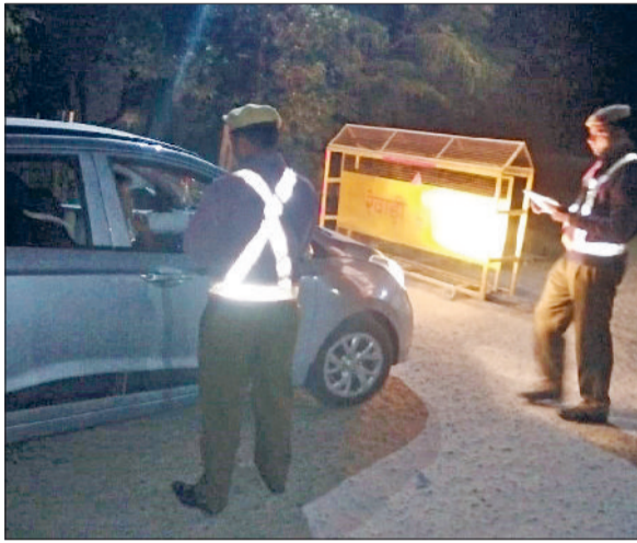
रेवाड़ी। नाके पर जांच करते हुए पुलिस।

नए साल का स्वागत करने के लिए साल के अंतिम दिन आधी रात तक लोग खुशी का इजहार करते हुए जश्न मनाते हैं। कुछ असामाजिक तत्व इसकी आड़ में गैर कानूनी हरकतों को अंजाम देने का प्रयास करते हैं। ऐसे लोगों से आमजन को सावधान रहते हुए खुद भी मर्यादित तरीके से नए साल का जश्न मनाना चाहिए। उन्होंने कहा कि शराब के नशे में सार्वजनिक स्थानों पर हुड़दंगबाजी करने वाले और बाइकों पर पटाखे बजाते हुए स्टंट करने वाले लोगों पर पुलिस की पैनी नजर रहेगी। ऐसे तत्वों के बारे में सूचना मिलते ही त्वरित कार्रवाई अमल में लाई जाएगी। उन्होंने कहा कि